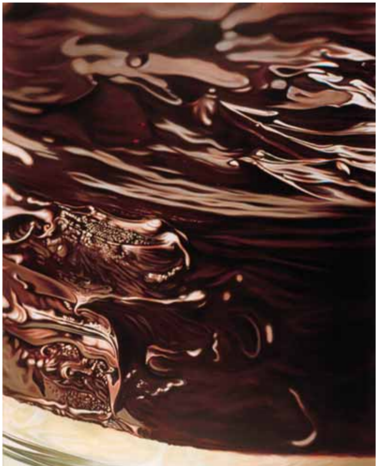
2 CHOCOLADETAART 1998 acryl op katoen 150 x 120 cm Collectie Hinke Kruike

Fotorealistisch is de term die moeiteloos op het werk van Cor Groenberg past, en niet alleen door de kenmerkende fotografische kwaliteiten. De kunstenaar benadert de wereld als keek hij door een macro-lens, hetgeen hij dan ook regelmatig deed: hij zoomt met een objectieve blik in op allerlei details en registreert deze vervolgens nauwkeurig en kritiekloos. Zo openbaart zich de glans van alledaagse zaken. Eenvoudig of logisch is die manier van kijken niet: de omgeving overschreeuwt een boeiend detail maar al te gemakkelijk. Zijn camera verfinde deze kijkwijze steeds beter, zodat Groenberg essentiële uitsneden uit de werkelijkheid inmiddels vaak direct in zijn hoofd kan isoleren. En deelt dat vervolgens met ons.