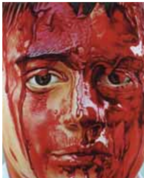
9 BLOED 2002 acryl op katoen 150 x 120 cm Collectie Kunstenaar