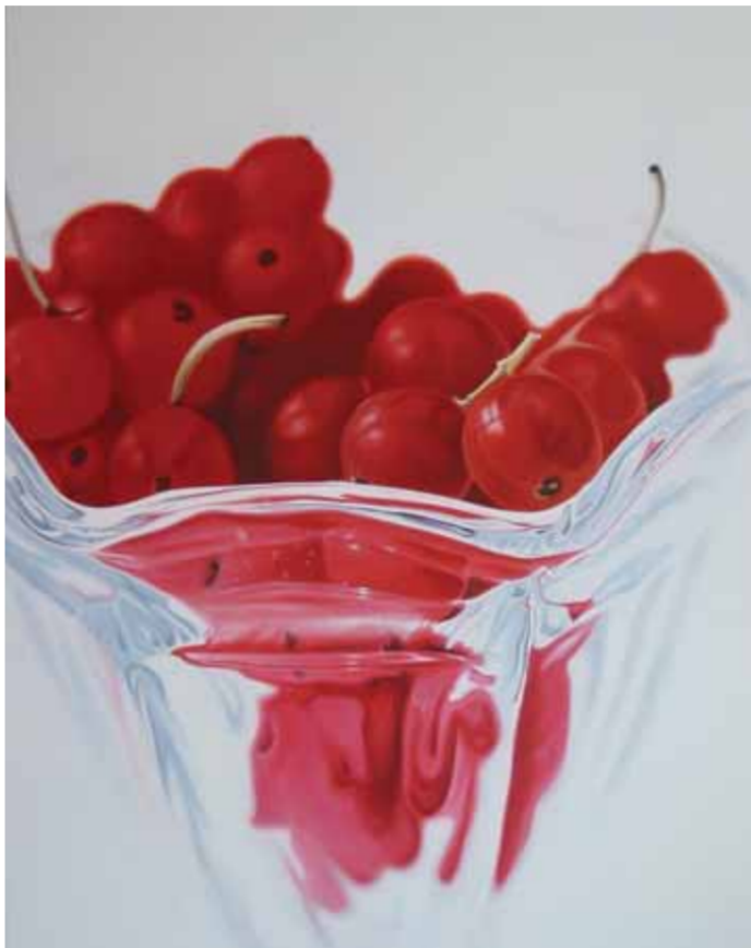
8 SORBET 2003 acryl op katoen 150 x 120 cm Collectie Drents Museum

Die wereld behelst niet alleen zelf met de camera gevangen details. De wereld biedt immers zo veel foto's waaruit de kunstenaar recentelijk meer en meer put als hij tijdschriften plundert. Uit het overvloedige aanbod knipt Groenberg zijn verzameling, ook hier geldt 'verrassing' als de norm om tot de collectie toegelaten worden. Zo ontstaat zijn eigen versie van het traditionele schetsboek. Waarbij de meeste van het overwelldigende aantal beelden, net als bij 'echte schetsen', niet verder wordt uitgewerkt. Wel interessante exemplaren verdwijnen gescand in de computer om er regelmatig een snelle blik op te kunnen werpen. Bewerkingen worden vervolgens niet geschuwd, waarbij vooral het dramatische uitsnijden van een detail belangrijk is. De extreme, al dan niet vervormende, close-ups versterken de uiteindelijke monumentale werking van de beelden. En drukken ons met de neus op de huid van een bier drinkende dame (afb.7) of een met bessen gevulde bokaal (fig.6). Het formaat is weliswaar opgeblazen, maar herinnert aan het originele fotoformaat. Overigens is het aardig dat de galerie van werken op zijn eigen website verder ingezoomde details van de oorspronkelijke schilderijen toont.