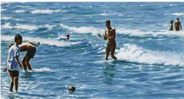
3 STRANDJONGENS 1996 acryl op katoen 20 x 30 cm Collectie Particulier, Groningen