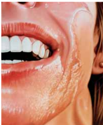
4 CUM FACE 1998 acryl op doek 150 x 120 cm Collectie Kunstenaar

Overeind blijvende foto's worden vervolgens in een serie geprojecteerd. In 1996 zien we diverse strandtaferelen waar het vooral gaat om de felle zon; schijnend op mensen en weerkaatsend in de schuimende golven. De foto is verscherpt door de maat te verkleinen (afb.3). Het is een opmaat naar de 'karpserie' uit 2000-01. Mannen torsen hun zojuist buit gemaakte, fikse karpers in de armen en zwellen pas echt op door het metershoge doek (afb.12). Het effect bevalt Groenberg: de meer dan levensgrote schaal staat garant voor een volgende verwijderende stap van het oorspronkelijke beeld. En vervreemt daarmee van de originele betekenis. Een logische volgende stap om het verhalende plaatjesgevoel verder te dringen, is het verwijderen van de achtergrond. Nu zitten we het model voor ons gevoel letterlijk op de huid. De uitsnijdingen gaan zonder pardon door haargrens of kinkultje. Bij 'Cum face' uit 1998 zien we zelfs niet meer dan een halve mond, een stukje neusvleugel en, daar, in de verte, nog een stukje oor (afb.4). Dat allemaal ten gunste van een hoofdrol voor details en scherptediepte. Uiteindelijk kiest de kunstenaar uit de geprojecteerde selectie de kandidaat die het meest verraste als model voor zijn nieuwe schilderij.