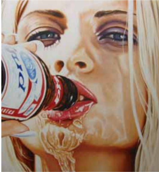
7 BUD 2004 acryl op katoen 70 x 65cm Collectie Particulier Groningen

'Camera peitura' betitelt de kunstenaar zijn werk poëtisch. De flirt tussen foto en schilderij is een intrigerend thema. Zo gaat het expliciet niet om de afgebeelde voorwerpen, een goede foto krijgt zelf de status van model. En die vraagt een zeer nauwkeurig naschilderen aangezien alle informatie objectief aanwezig is. Maar hoe vertaal je dat naar verf? Schilders idealiseren hun voorstellingen al eeuwen, denk aan flatterende portretten. Groenberg schaarft zich in deze traditie als hij zijn onderwerp idealiseert, alleen praten wij hier over de foto. Een spatje meer kleur, een contrast even wat zwaarder aanzetten, het maakt het schilderij fotografischer dan de informatie die de foto zelf geeft. Al blijven de effecten altijd geheel 'in de geest van' de opname. Daarnaast is scherptediepte een typisch fotografisch effect, waar Groenberg mee speelt door onscherpe delen in zijn schilderijen toe te voegen. Dit zien wij in het dagelijkse leven niet direct.