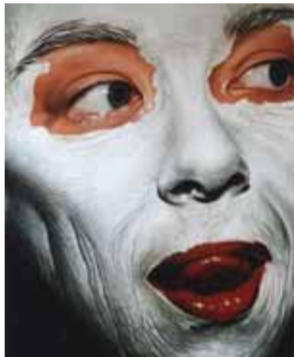
10 KLEIMASKER 1998 acryl op katoen 150 x 120 cm Collectie Quaron N.V., Zwijndrecht