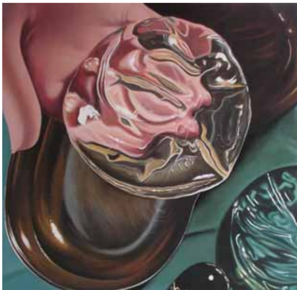
11 SILICONEN 2006 acryl op katoen 85 x 85cm Collectie Kunstenaar